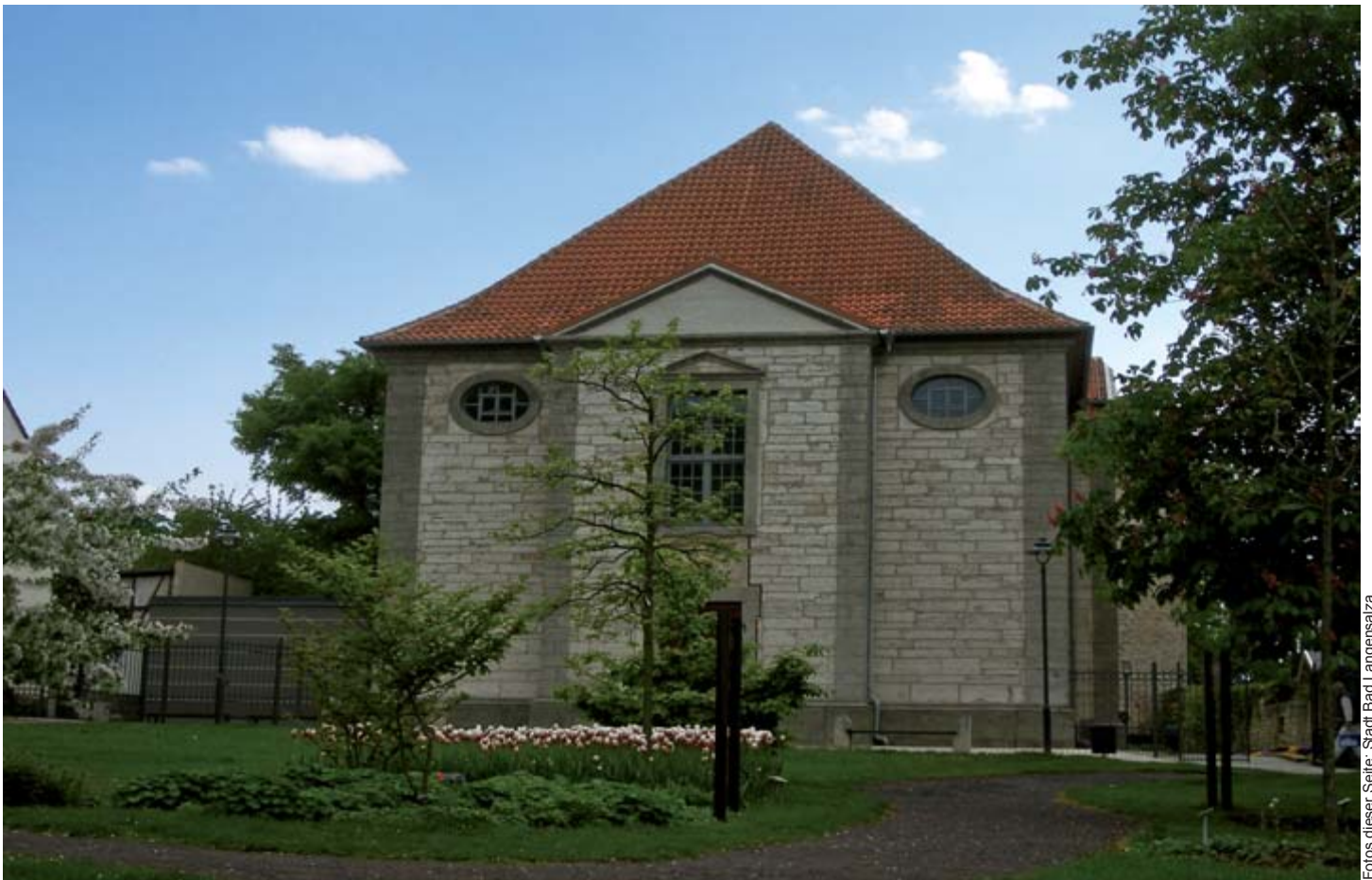
Auch das Umfeld der Gottesackerkirche in Bad Langensalza profitierte von den Investitionen im Rahmen der nachhaltigen Stadtentwicklung