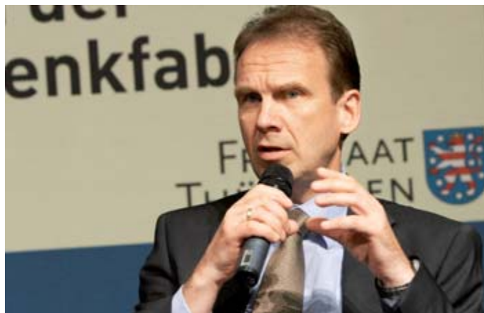
Für nachhaltige Investitionen: Ministerpräsident Dieter Althaus

gelegenen und Chancengleichheit der Europäischen Kommission, Lenia Samuel, sieht den Ansatz zur Bewältigung der Krise in mehr Bildung und Qualifikation. Hier müsse europaweit mehr investiert werden. „Investitionen in die Infrastruktur allein reichen nicht aus.“ Die Kommission will einen Fachkräfte-Atlas für Europa erarbeiten.