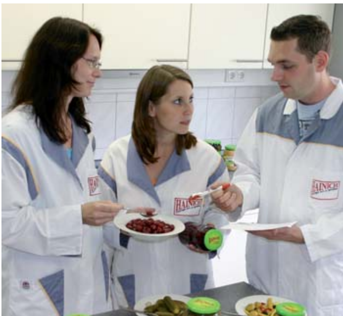
Familienfreundlichkeit hilft junge Fachkräfte in der Region zu halten