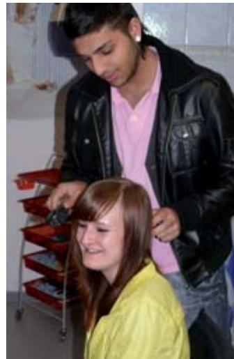
Ein Berufsfeld: Körperpflege

ten die notwendige Ausbildungsreife und gehen ihre persönlichen Probleme aktiv an. Junge Menschen werden durch die Perspektive auf einen sicheren und anspruchsvollen Arbeitsplatz mit Zukunftschancen