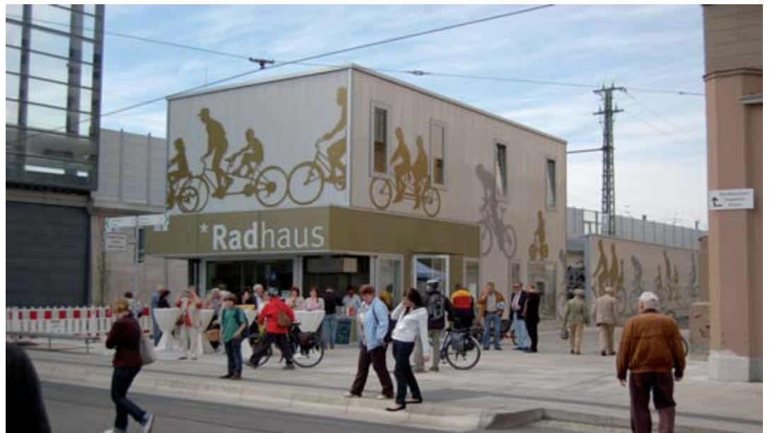
Der Erfurter Hauptbahnhof ist eine der größten Städtebauinvestitionen in der Landeshauptstadt

Denn auch aus europäischer Perspektive ist nachhaltige Stadtentwicklung ein ganz ak-