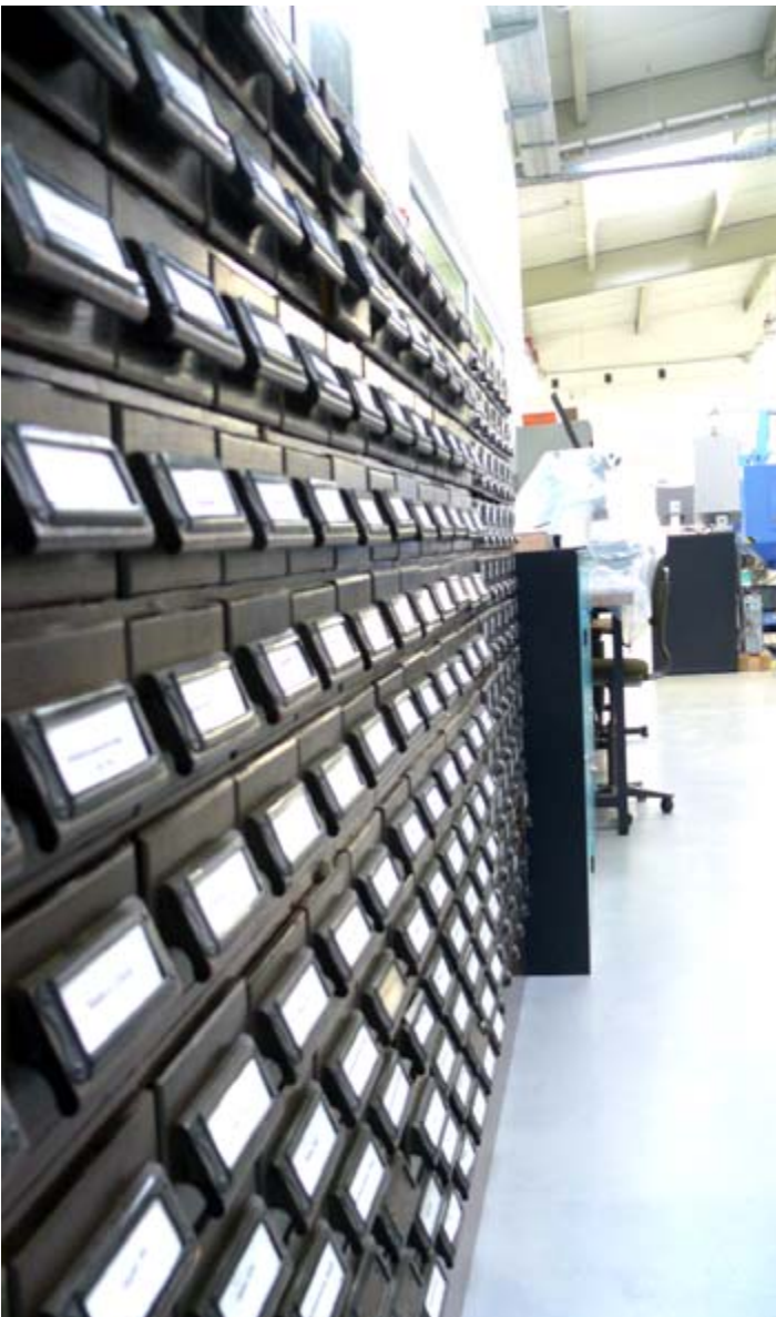
Bis zu 4 Mio. Schalter und Baugruppen verlassen jährlich die Febana GmbH

zeitlich versetzt eingeholt“. Zwar kann ein Teil der Umsatzverluste im Automobilzulieferbereich durch die Hausrätetechnik aufgefangen werden, aber der Umsatz des Jahres 2008 mit 5,2 Mio. € wurde für das laufende Jahr schon auf 4,2 Mio. € korrigiert. Der Senior-Geschäftsführer sieht die Entwicklung dennoch gelassen. Bei einer Produktionskapazität von jährlich 3,5 bis 4 Mio. Schaltern und Baugruppen sowie 100 Mio. Stanzteilen und der Investitionen der vergangenen Jahre vertraut Siegel auf bessere Jahre. Seit 1992 wurden rund 5,2 Mio. € investiert. Davon von April 2007 bis Dezember 2008 für einen Erweiterungsbau rund 1,4 Mio. € und für neue Maschinen rund 400.000 €. Die Mittel wurden anteilig aus dem Europäischen Fonds für Regionalentwicklung und der Gemeinschaftsaufgabe „Verbesserung der regionalen Wirtschaftsstruktur“ bereitgestellt. www.febana.de