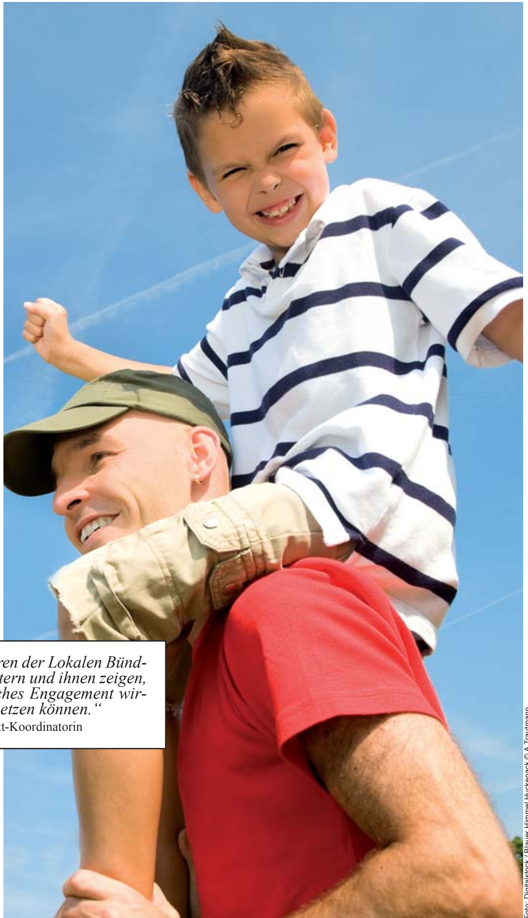
Wünsche von Müttern und Vätern: Kinderbetreuung, elternfreundliche Arbeitsplätze und ein gutes soziales Umfeld