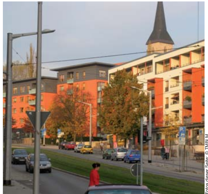
Nordhausen: Schöne Innenstädte mit Wohlfühlgarantie

Der Erhalt und die Entwicklung der historischen Stadtzentren werden in Thüringen weiterhin