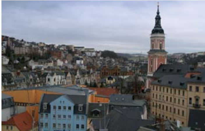
Lebenswertes Thüringen - Greiz aus der Vogelperspektive

Diese Mittel aus den europäischen Strukturfonds geben dem