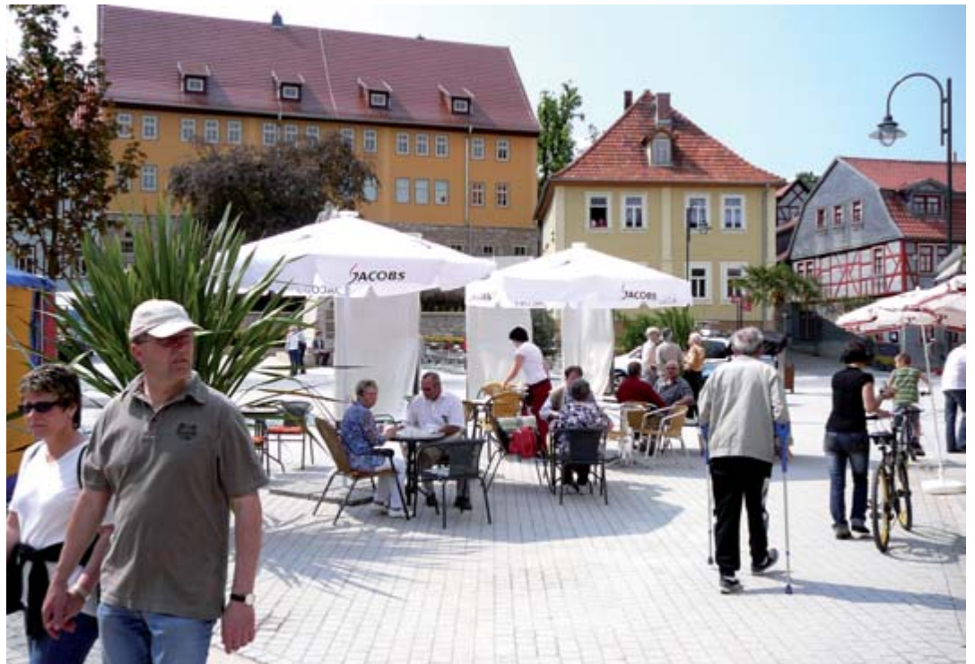
Eine attraktive Innenstadt: Immer mehr Menschen wollen auch hier wohnen

neuer Bänke und Baumscheiben auf 3,2 Mio. €. www.bad-langensalza.de